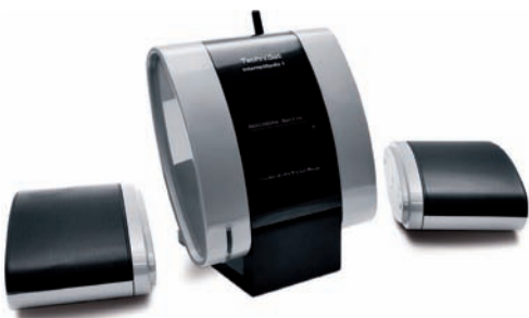
Die Lautsprecher können vom Gerät getrennt werden

Hören, das ist es! Die Tonqualität hat zwar keine Konzertsaalqualität, reicht aber für die meisten Gelegenheiten aus. Beeindruckend ist