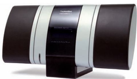
Ansprechend elegante Vorderseite

Das gute alte Radio hat sein Nischendasein verlassen und erlebt zurzeit eine Renaissance. Dies liegt daran, dass endlich die ganze Welt erreichbar ist. Bringt der Empfang im UKW oder Kabel 12 bis 40 Sender aus dem unmittelbaren Umfeld, kann man über die Set-Top-Box bereits mehr als 150 digital ausgestrahlte nationale und internationale Sender empfangen – in bester Qualität! Doch das derzeit absolute Non-Plus-Ultra ist das IP-Radio: Mehr als 4.500 Sender sind über das allgegenwärtige Internet, also über den heimischen Computer, empfangbar. Mehr als 440 Millionen Einträge gibt es hierzu im Netz. Hier auf Anhieb das Richtige zu finden, ist beinahe schier unmöglich und für den Radiohörer eher abschreckend als hilfreich. Zusätzlich muss immer der PC eingeschaltet und mit der HIFI-Anlage verbunden werden. Der Internetanschluss allein reicht hier nicht aus.